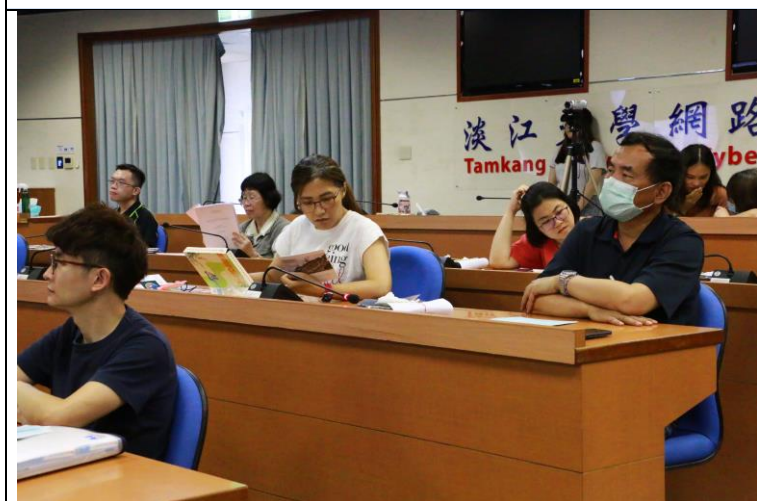
與會老師翻閱謝主任頂石課程之學生成果