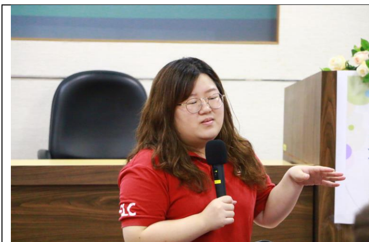
助教以學生的角度回答與會老師問題