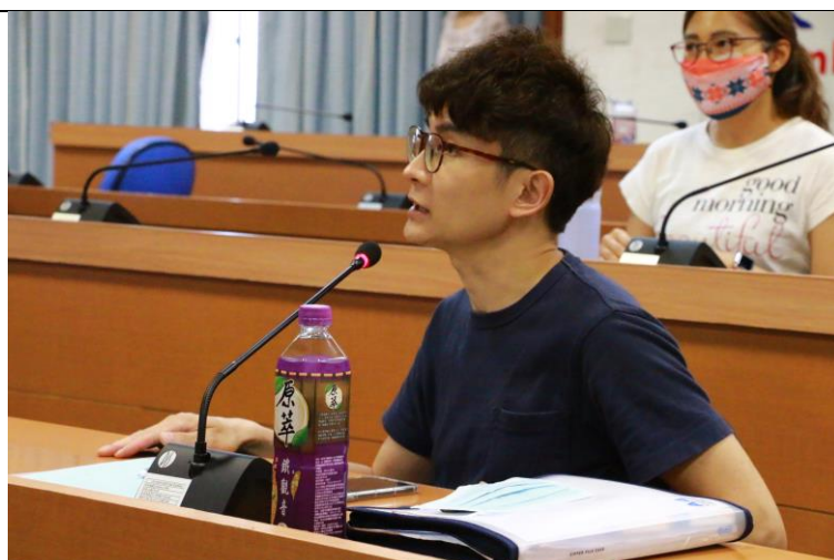
與會老師提出計畫花費之時間心力，是否會影響學生其他學科的成績問題