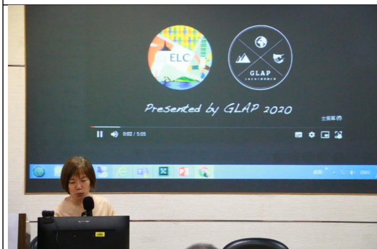
謝主任展示學生畢業專題成果心得之影片