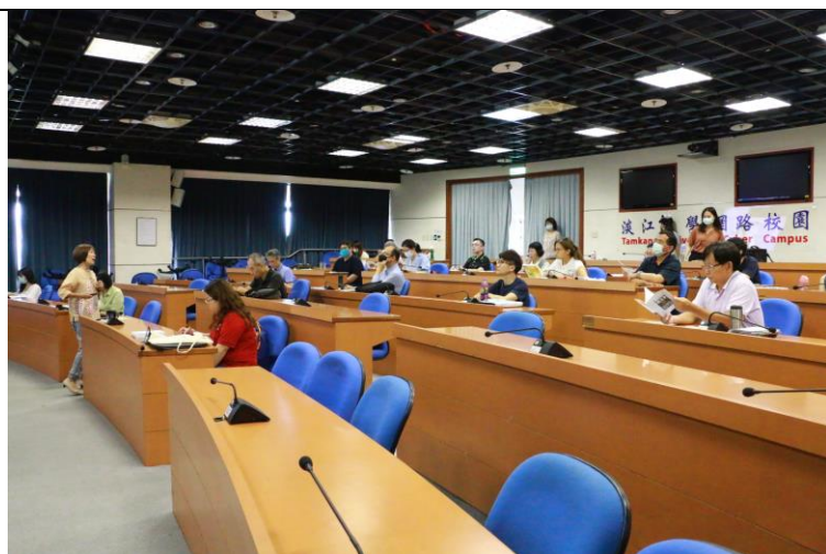
與會老師專心聆聽謝主任分享全球在地之頂石實踐