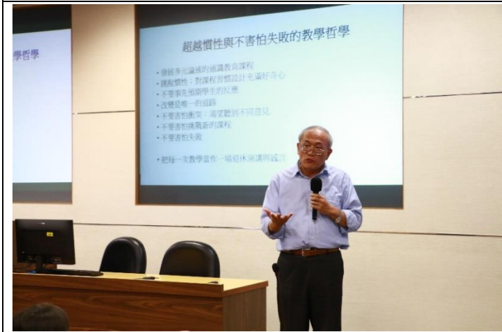
陳老師認為教學不應害怕失敗，應當愈挫愈勇