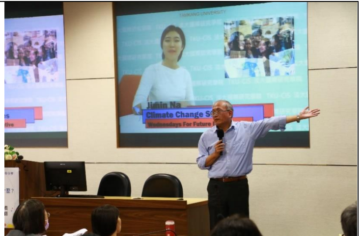
學生透過環境議題以新聞方式呈現