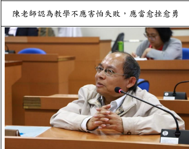
與會老師表示觀後想法