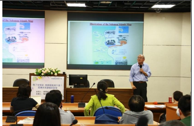
陳老師展示學生作業，並說明學生來自不同國家對環境議題的重視面向有所不同