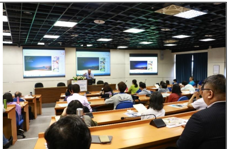
與會老師專注聆聽演講