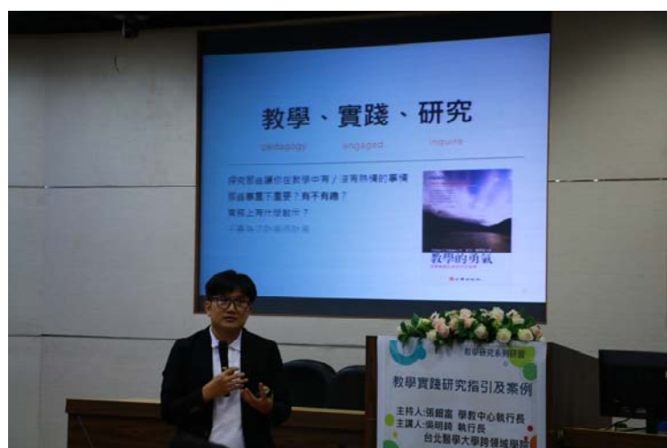
思考教學實務上給予你的啟示