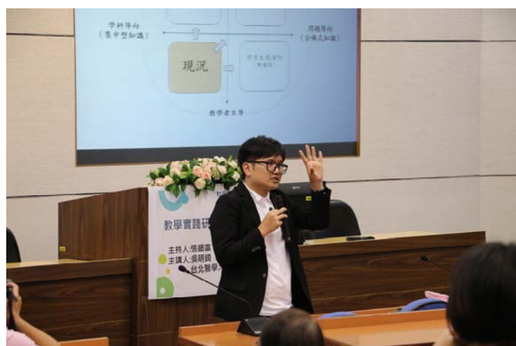
挪動視角重新理解教與學