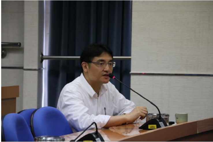
與會老師詢問如何引起學生的學習動機