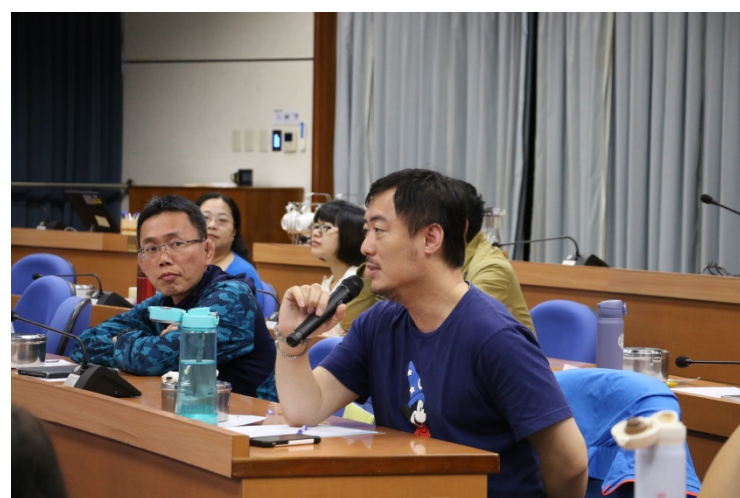
與會老師分最喜歡的一門課中值得探討的問題