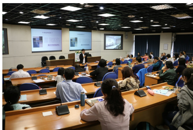
吳執行長分享值得探討的議題