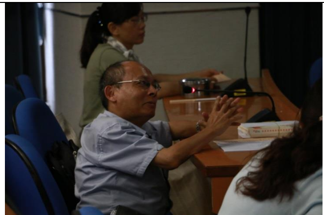
與會老師提問關於同課程不同班級的學生評分基準不同，能否有一系統讓學生亦能評鑑其他班級的老師？