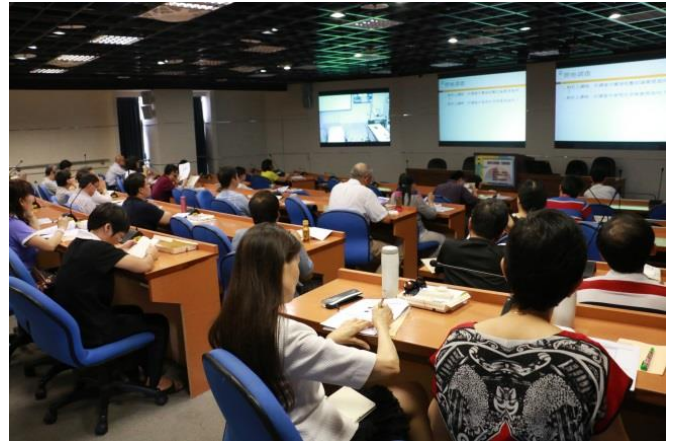
與會老師認真聆聽、筆記