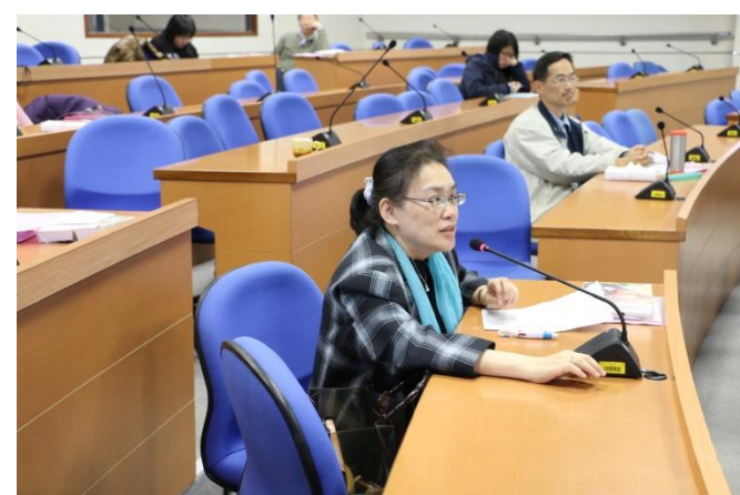
綜合座談(Q&A)老師踴躍發言