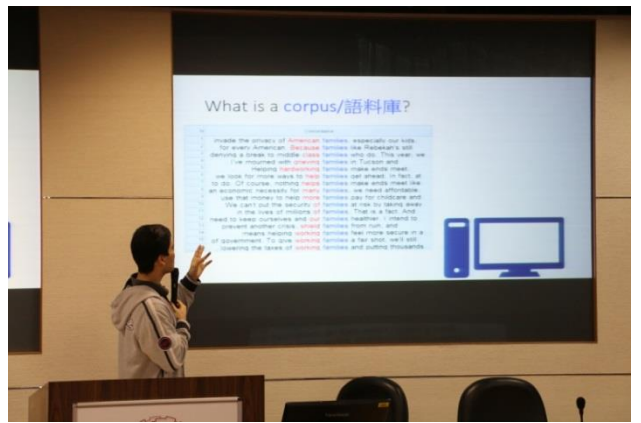
語料庫原理介紹與說明