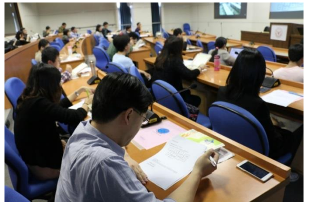
與會老師專注聆聽