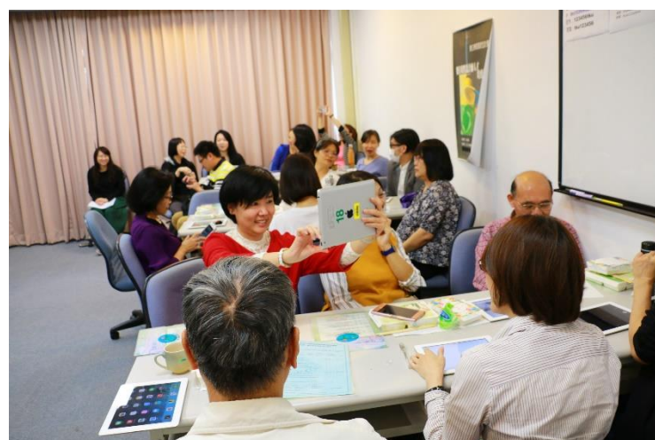
課堂活動：與會老師為彼此錄影