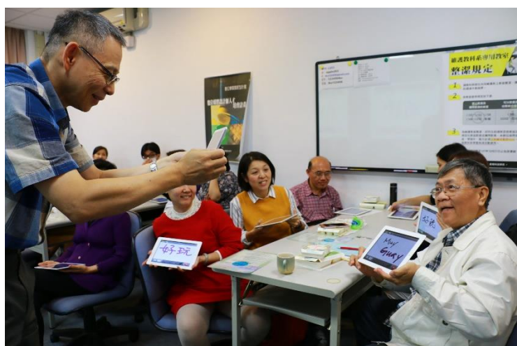
李老師拍下每位老師回答的內容