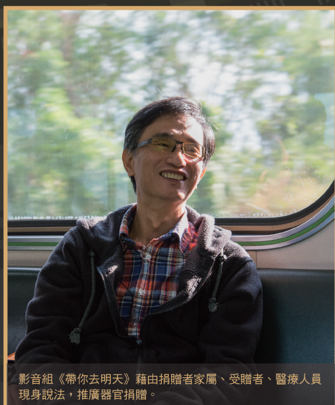
影音組《帶你去明天》藉由捐贈者家屬、受贈者、醫療人員現身說法，推廣器官捐贈。

本系統整合之課程，可培養學生企劃能力、數位影音製作能力、網路行銷以及策展能力，學生可以學習動態展示之策展能力。