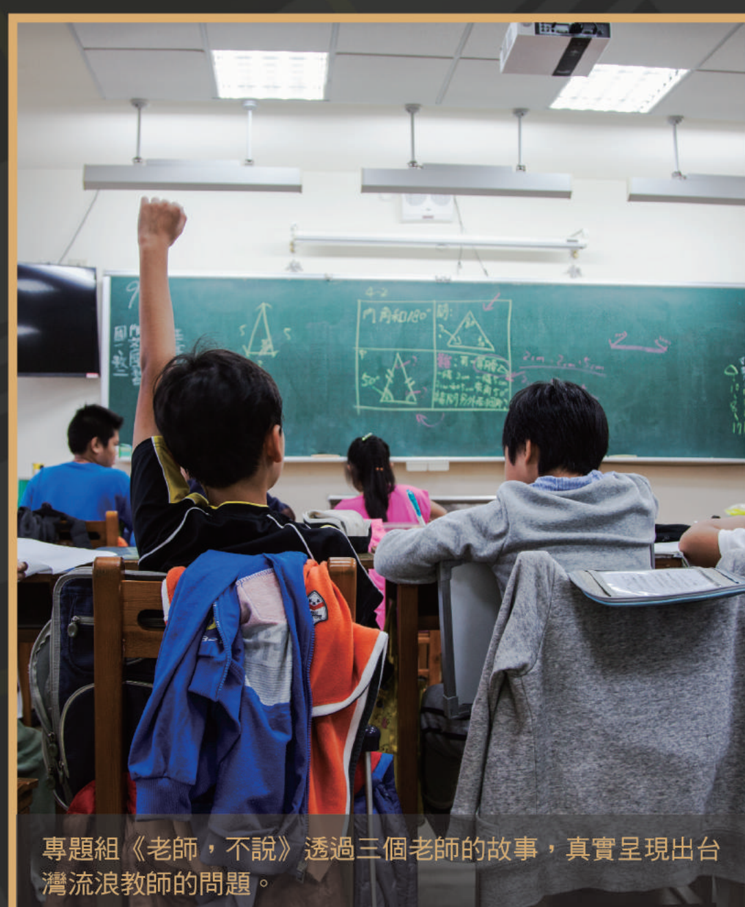
專題組《老師，不說》透過三個老師的故事，真實呈現出台灣流浪教師的問題。