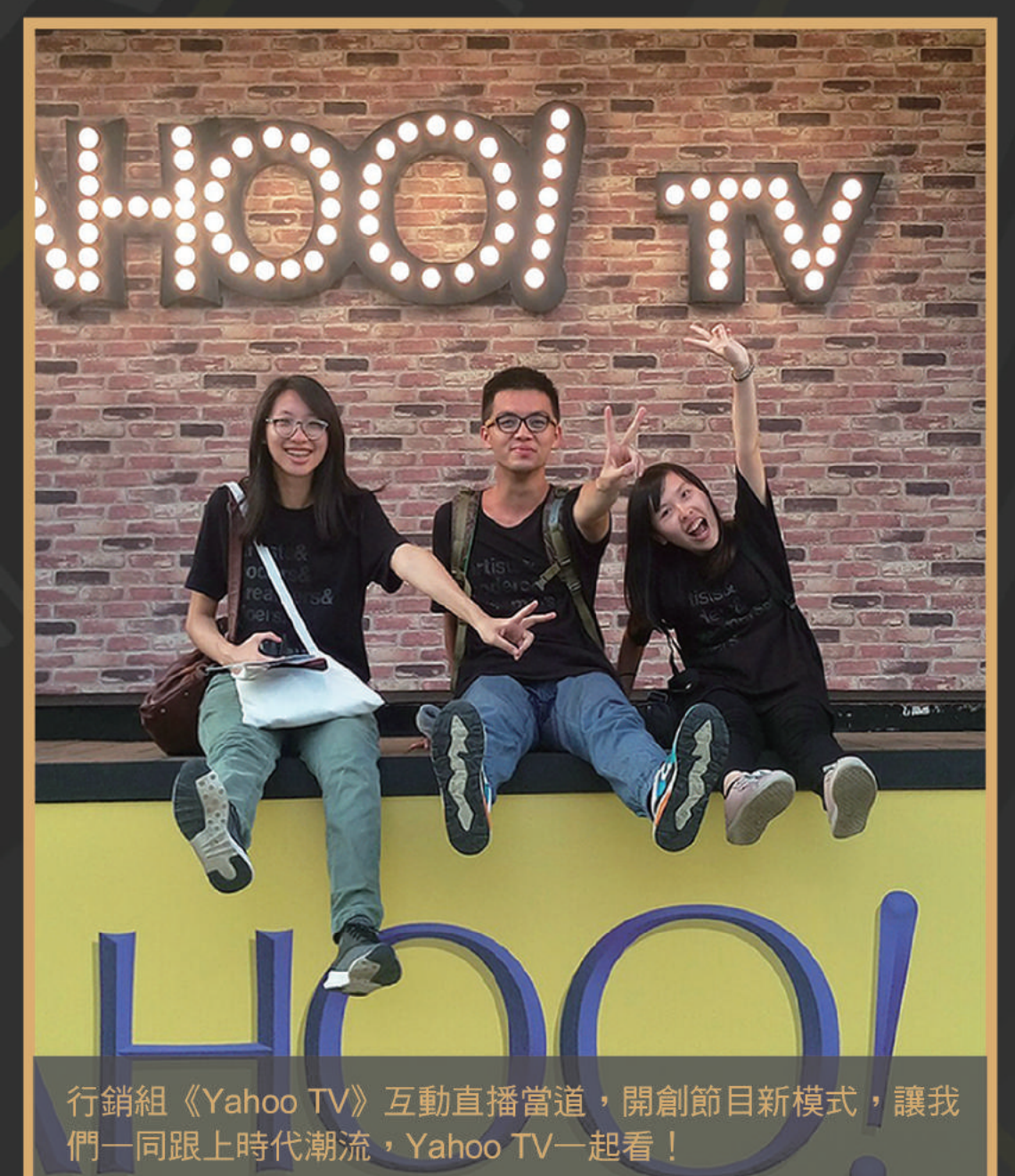
行銷組《Yahoo TV》互動直播當道，開創節目新模式，讓我們一同跟上時代潮流，Yahoo TV一起看！