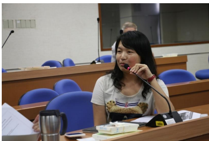
與會老師宣傳關於 CLIL 社群活動