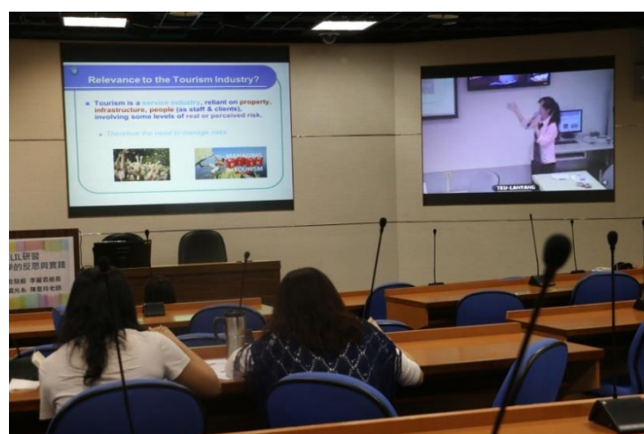
陳老師分享學習 CLIL 教學後的改變