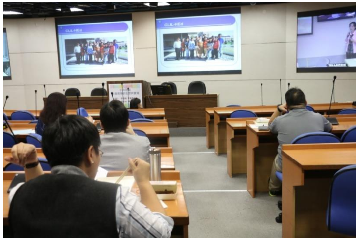
CLIL 研習活動經驗分享