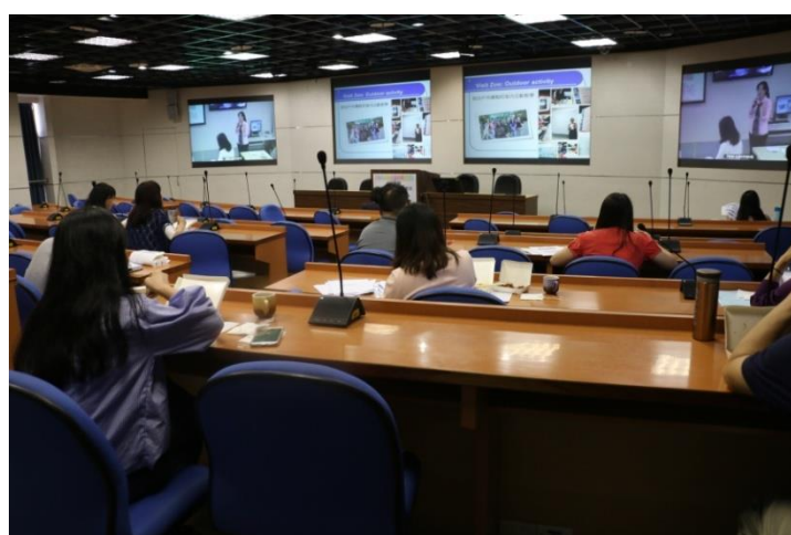
與會老師專注聽講