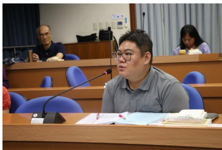
與會老師提問關於學生分組問題