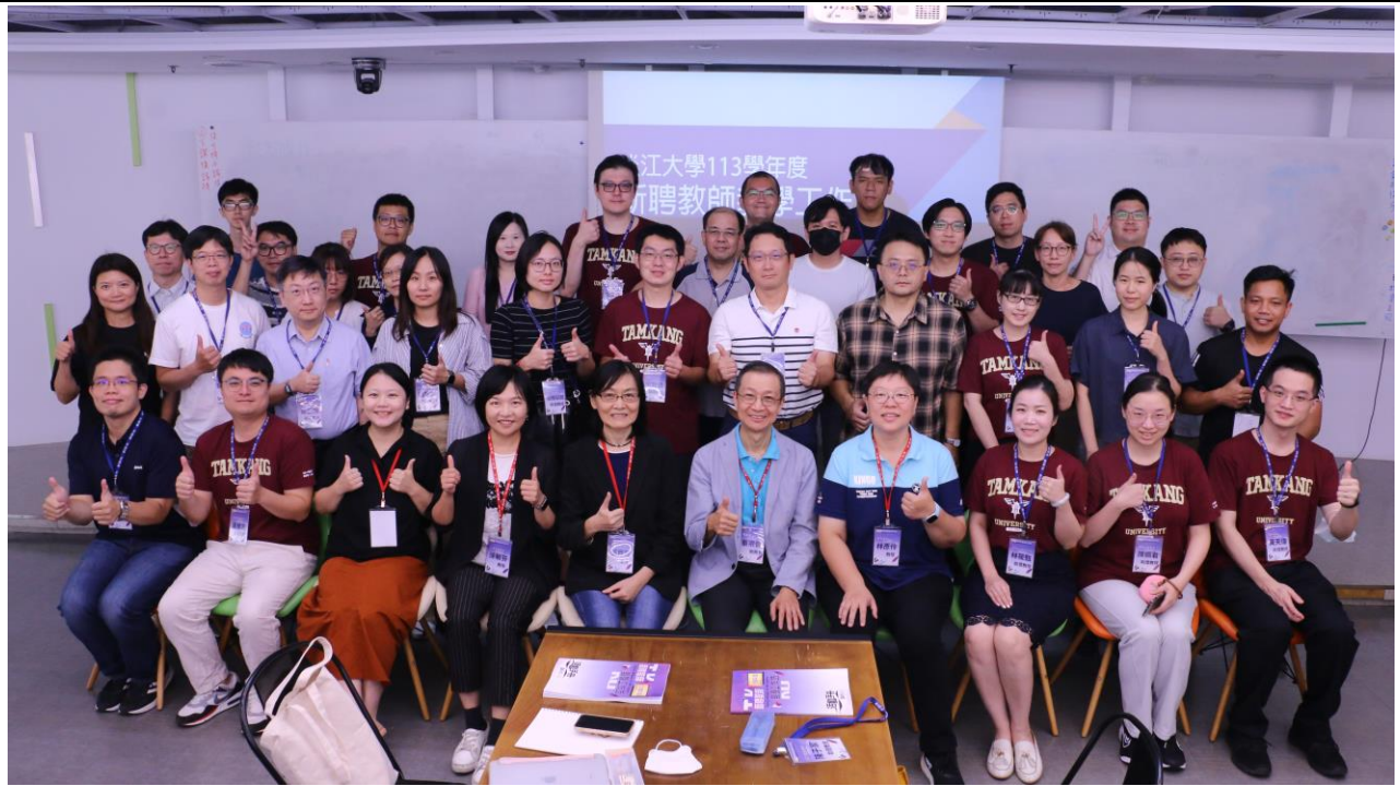
淡江大學 113 學年度新聘教師、四位主講者與教務長全體合照