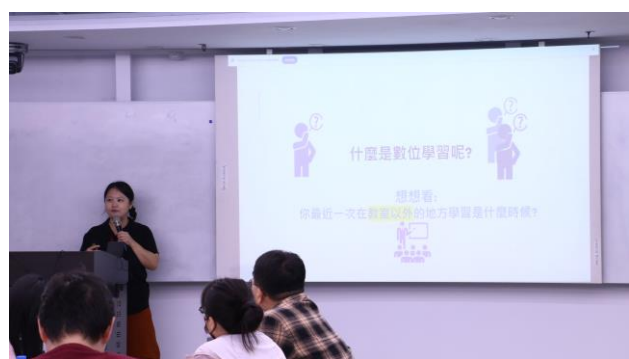
王老師主講「用科技、助教學」