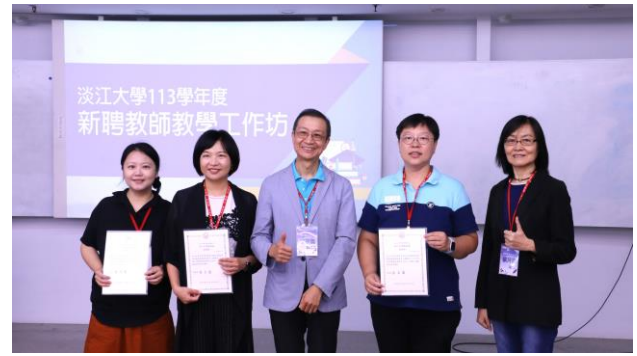
教務長、三位主講者與張主任合照