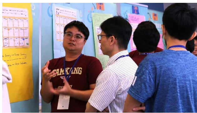
新聘教師進行分組討論與交流活動