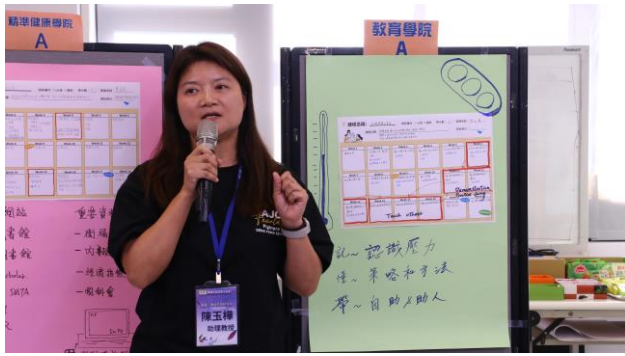
新聘教師發表課程流程設計之實作成果(2)