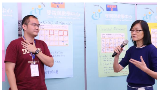
新聘教師發表課程流程設計之實作成果(1)