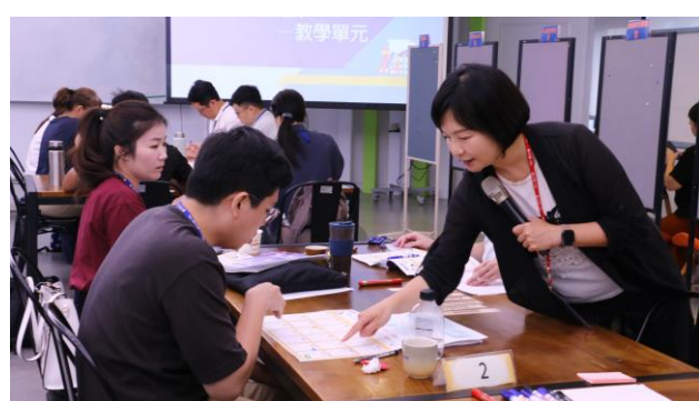
新聘教師進行工作坊實作活動