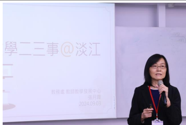
張主任主講「教學二三事 in 淡江」