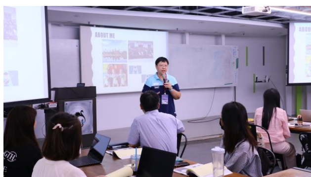
林老師主講「大學，你想怎麼教?」