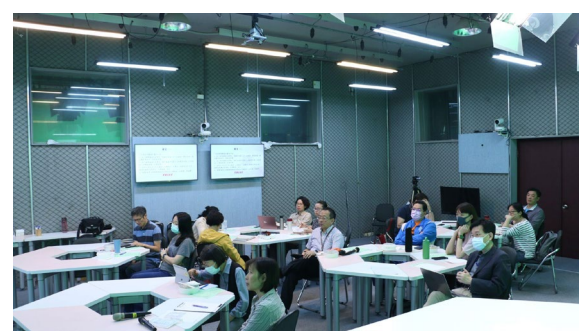
與會教師專注參與研習