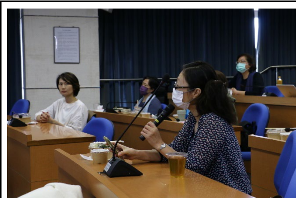
與會教師熱烈回饋與提問