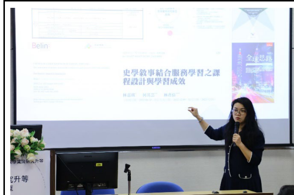
林 老師提醒申請 ISBN 之重要性