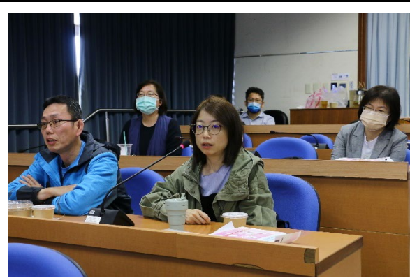
與會老師專注參與研習