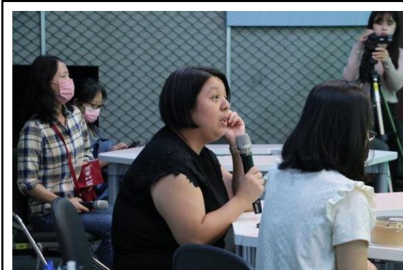
與會教師熱烈參與研習交流與討論