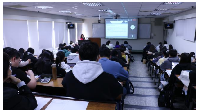
學生專注參與課堂教學