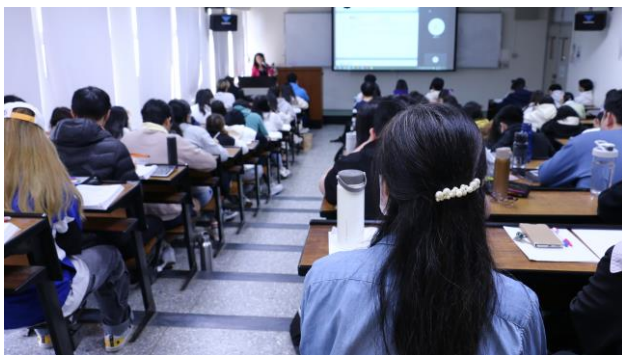
觀課教師專注參與課堂教學