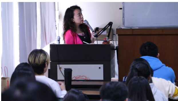
張老師以平板電腦同步進行筆記與計算教學