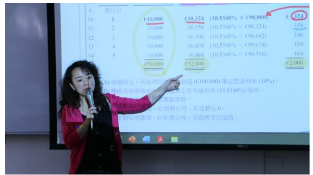
張老師提供運算範例進行講解