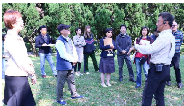
觀課教師專注參與課堂互動