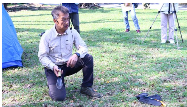
黃老師進行挖貓眼演示教學