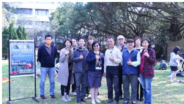
李主任、觀課教師與黃老師全體合照