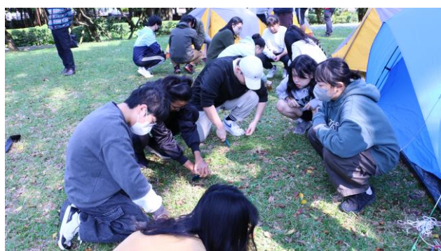
學生進行實際演練活動