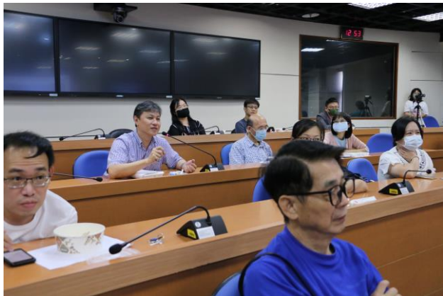
與會老師熱烈參與研習交流與回饋