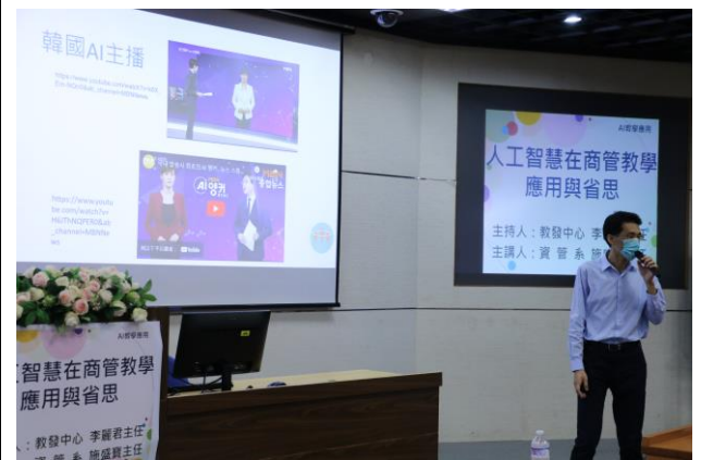
施 主任分享 AI 科技的應用與發展現況