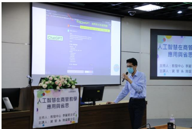
施 主任示範 AI 科技的操作與功能介紹