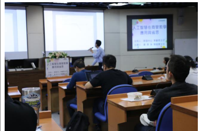
與會老師專注參與研習活動