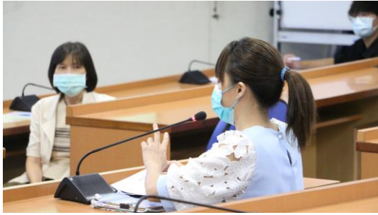
與會教師專注參與研習分享與討論