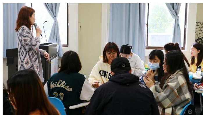
張老師於課堂給予學生適時的文法、單字、讀音修正