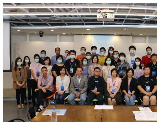
109 學年度新聘教師及主講教師全體合照