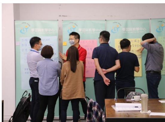
新聘教師分享自己的教學藍圖