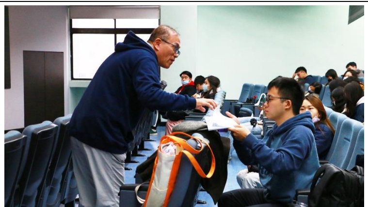
陳 老師將學習單發給學生。