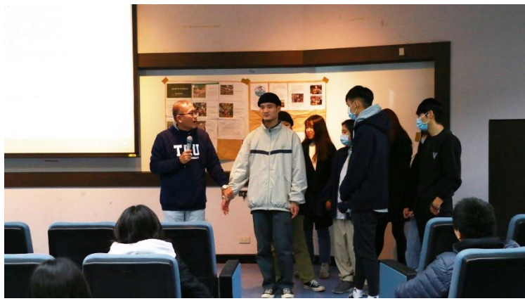
陳老師邀請同學作為「導盲犬體驗」示範組。