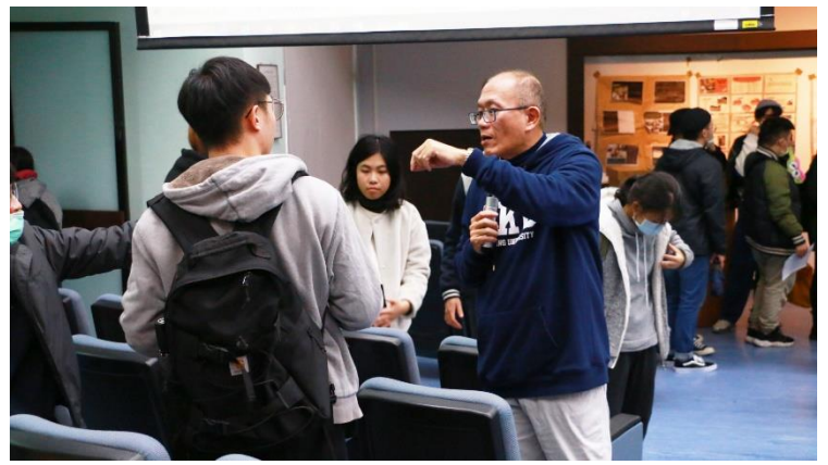
陳老師提醒同學注意安全以及詢問學生體驗路徑。