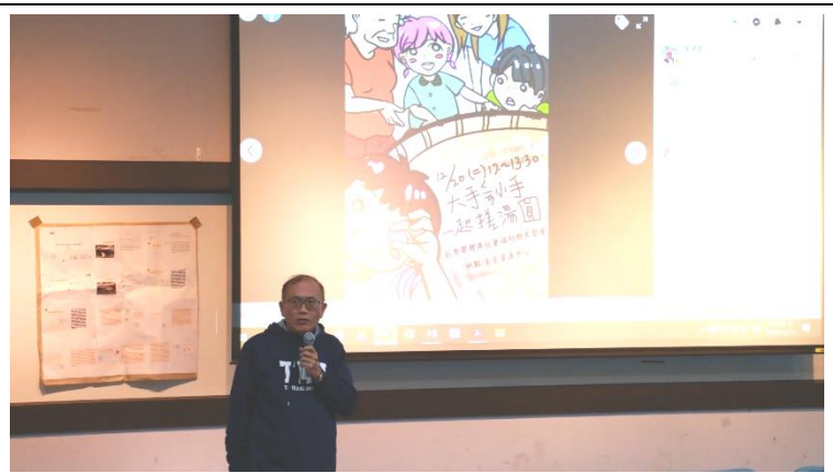
陳 老師分享過去課堂與淡江盲生資源中心合作的經驗。