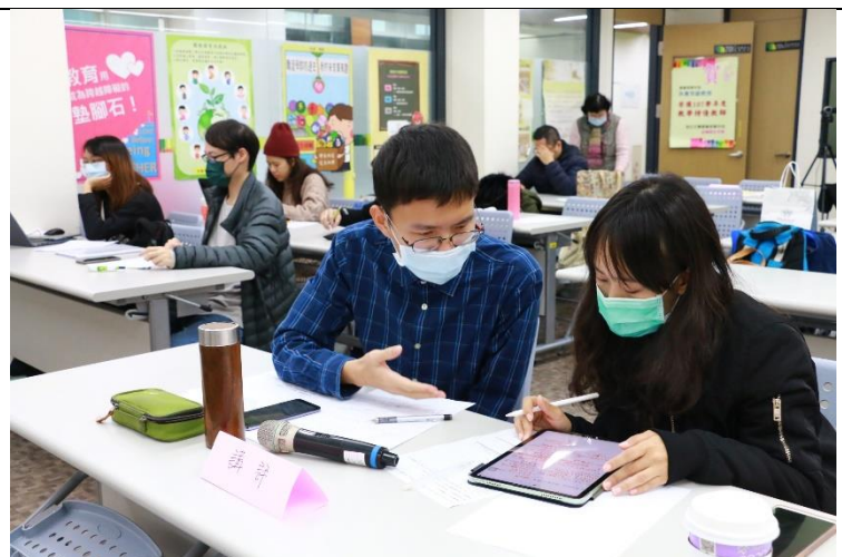
裁判針對正反方進論點進行記錄與討論。