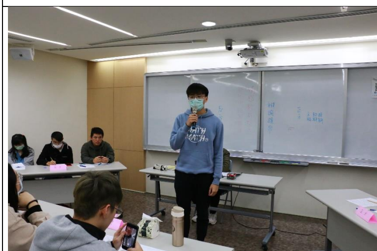
台下學生分享觀賽心得。