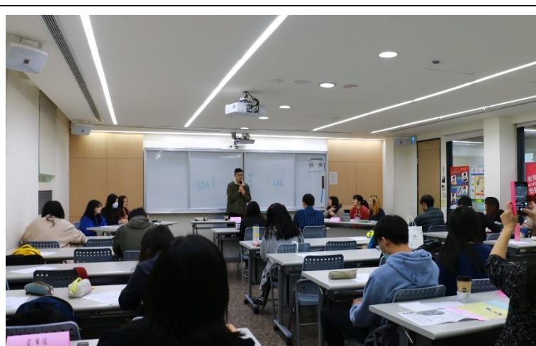
辯論賽主持人進行開場說明。