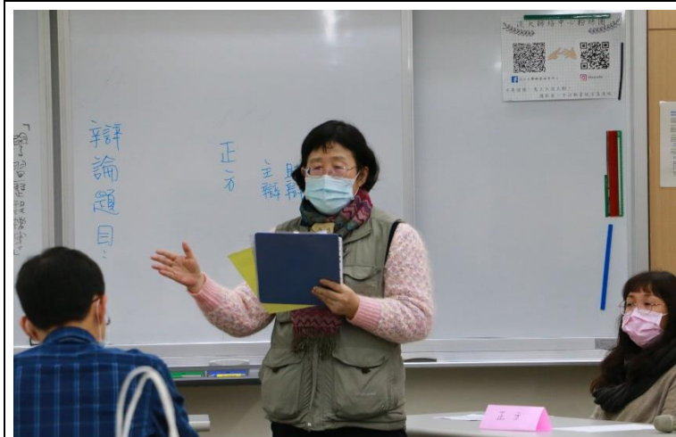
朱老師針對辯論內容與過程進行回饋與分享。