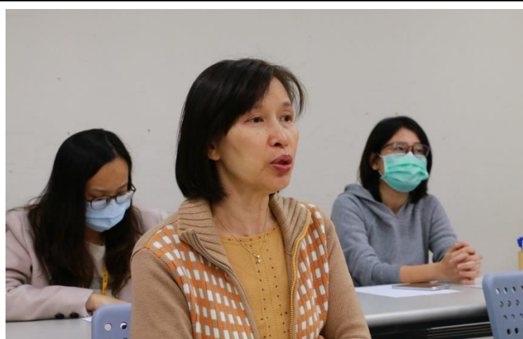
與會老師給予辯論選手鼓勵與回饋。