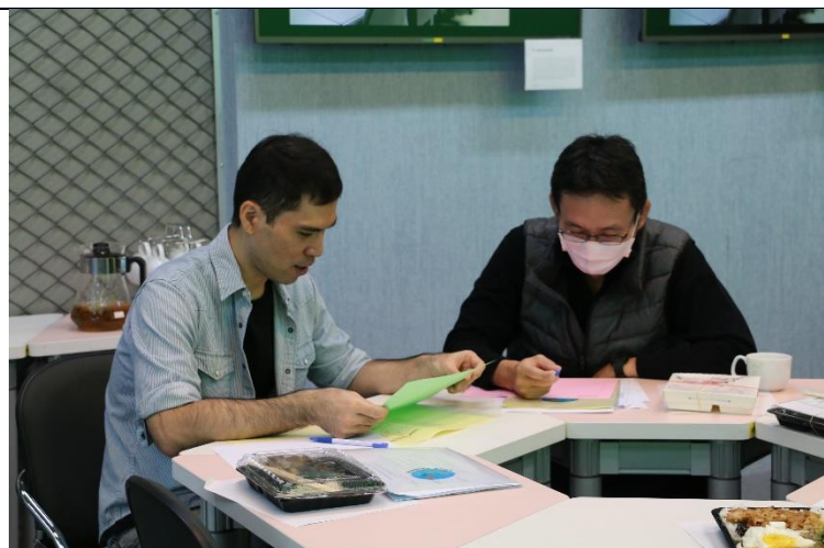
與會老師體驗 CLIL 實作活動-Co-operative Listening