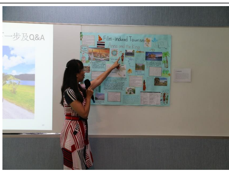
陳老師展示學生於 CLIL 課程中製作之成果