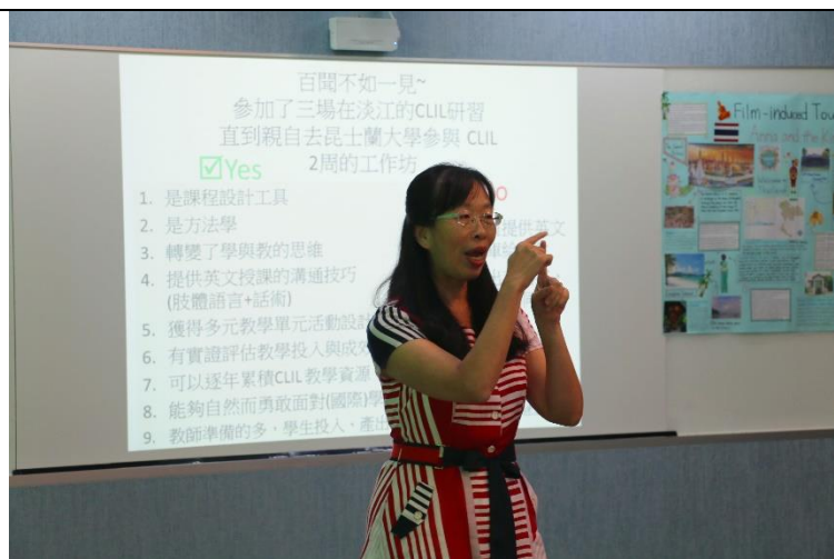
陳老師分享在昆士蘭大學的所聞