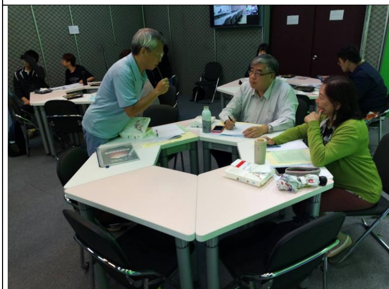
與會老師體驗 CLIL 實作活動-Running Dictation