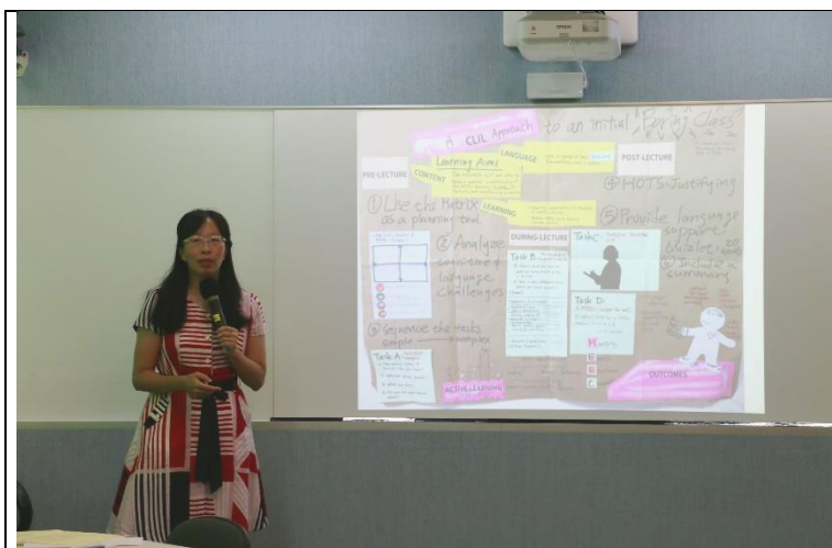
陳老師分享 CLIL 應用的例子