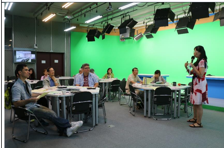
與會老師專注聆聽陳老師的分享